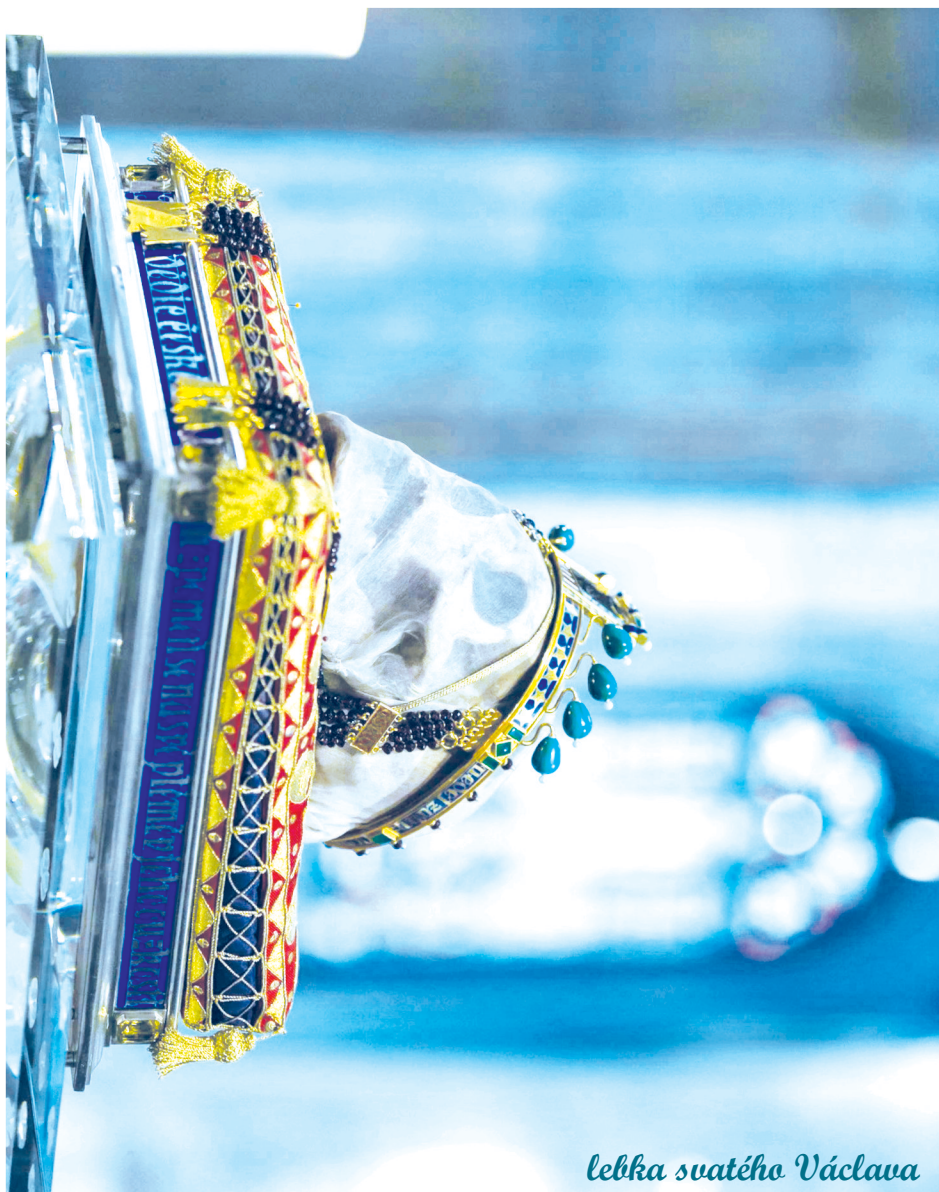
lebkka suatého Václava