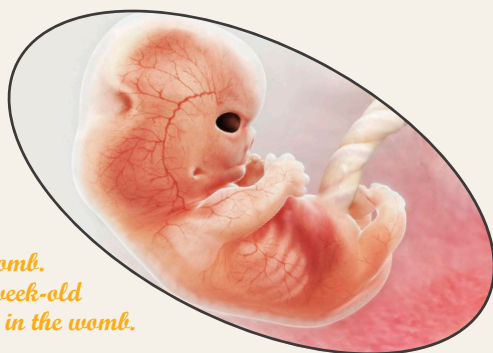
Human foetus in the womb. Computer artwork of a 9-week-old (gestational age) human foetus in the womb.